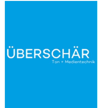
Überschär Medientechnik Ansprechpartner Technik Kontakt@ueberschaer.info +49 (0)171 9779312